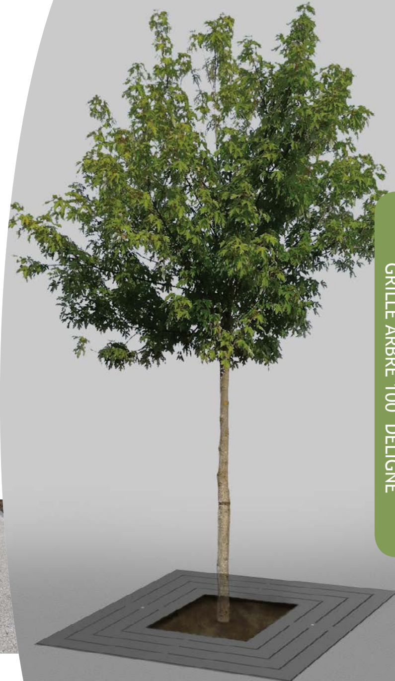
GRILLE ARBRE 100 DELIGNE