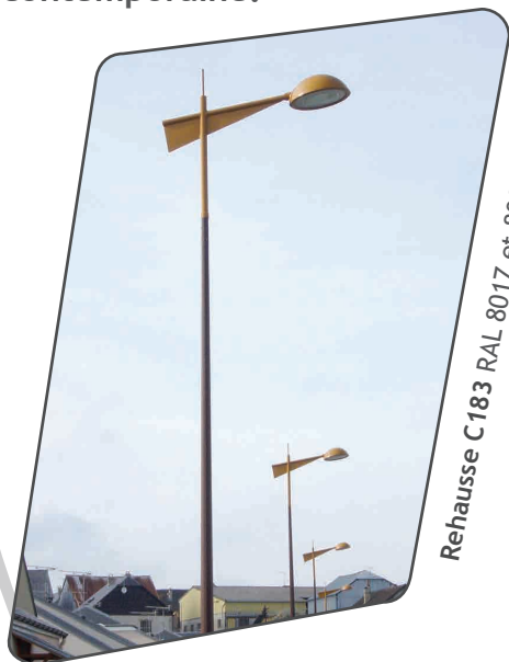
Rehausse C183 RAL 8017 et 8001

Les formes dynamiques et actuelles du luminaire Odémi valorisent vos espaces en leur apportant une lecture plus contemporaine.