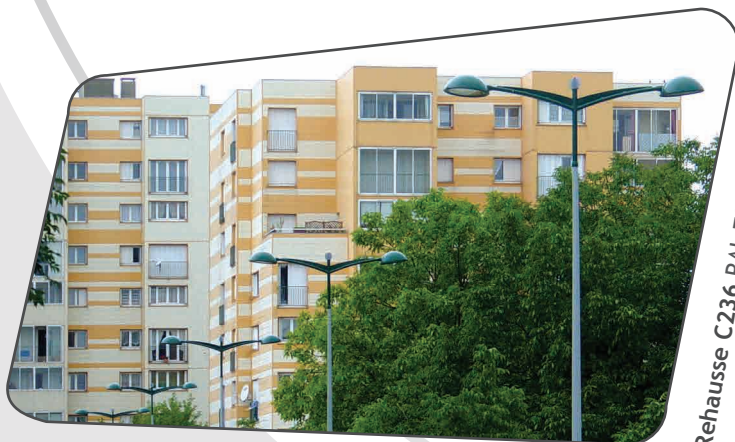
Rehausse C236 RAL 7001 et 6005