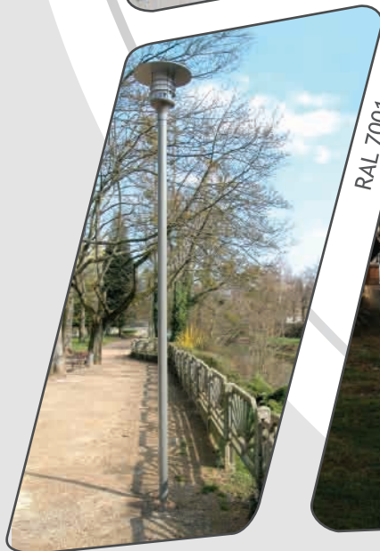
RAL 7001 et 5014