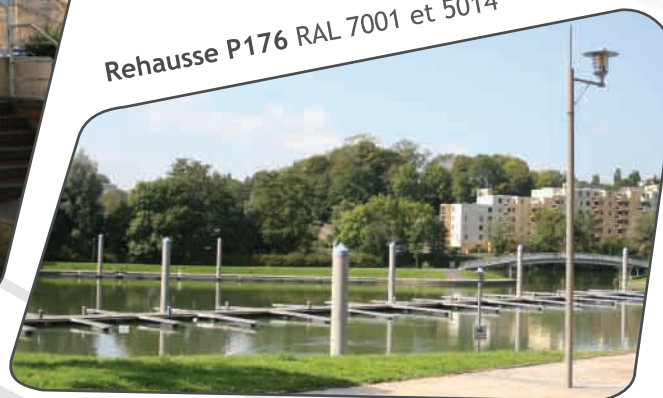
Rehausse P176 RAL 7001 et 5014