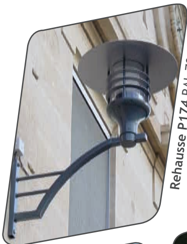
Rehausse P174 RAL 7012

Luminaire résidentiel, Signy s'intègre dans tous les quartiers même sensibles, sa technicité lui permet d'éviter la pollution lumineuse. Sa robustesse et sa facilité d'entretien le rendent d'une grande économie d'usage.