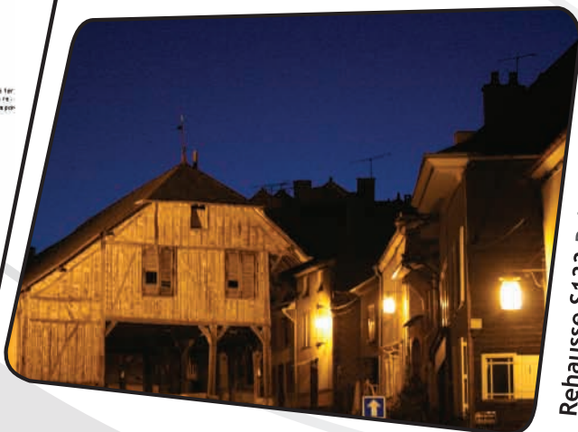
Rehaussé S133 Ral 9005