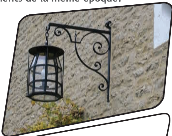
Lanterne Bleu 700 sablé

Lanterne historique (dite à seu) apparue à la fin du XVIIIème siècle dans les grandes villes de France, la Wasigny s'intègre naturellement à tous les quartiers urbanisés avant 1850 ou sur tous les bâtiments de la même époque.