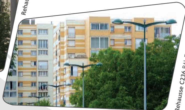
Rehausse C236 RAL 7001 et 6005