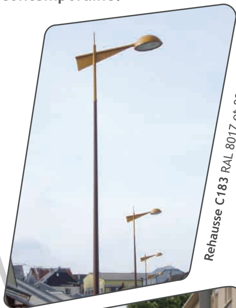
Rehausse C183 RAL 8017 et 8001

Les formes dynamiques et actuelles du luminaire Diabolo C valorisent vos espaces en leur apportant une lecture plus contemporaine.