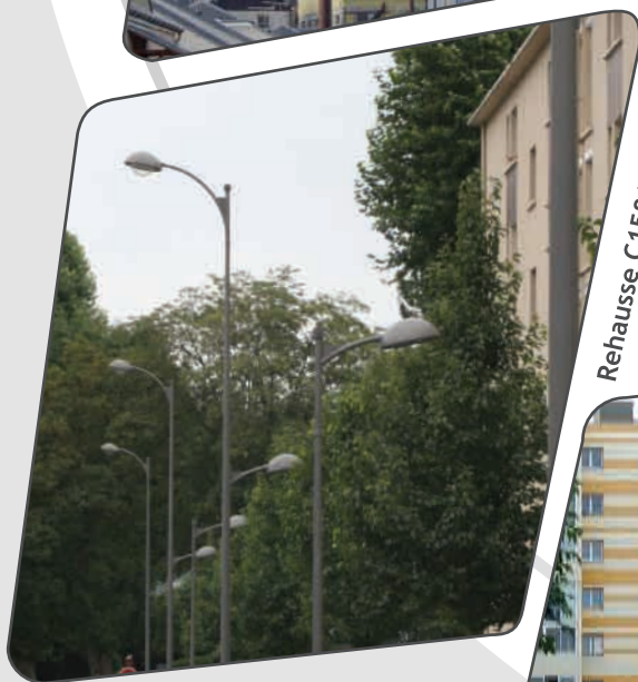
Rehausse C158A Gris 900 sablé